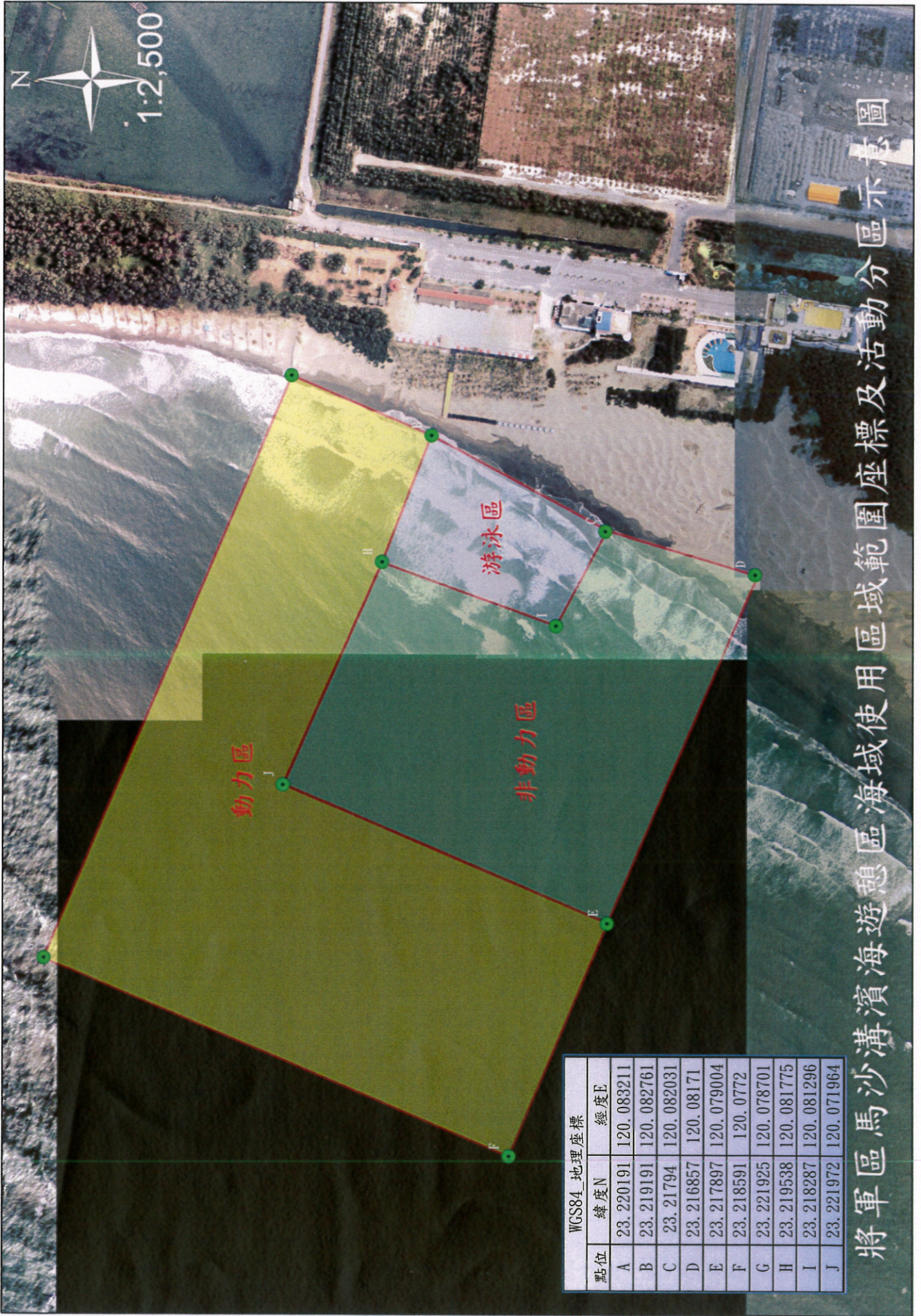
將軍區馬沙溝濱海遊憩區海域使用區域範圍座標及活動分區示意圖