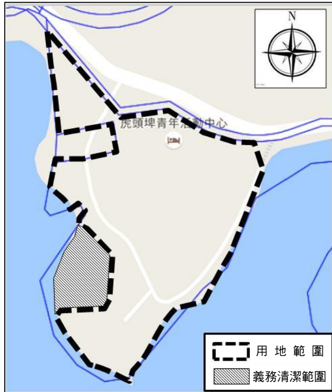
圖 1 本案用地範圍示意圖