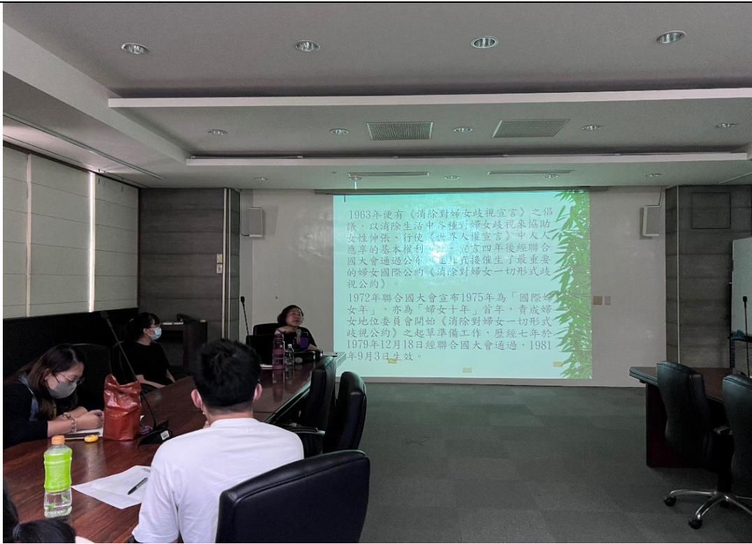
112. 07. 25 講師上課照片