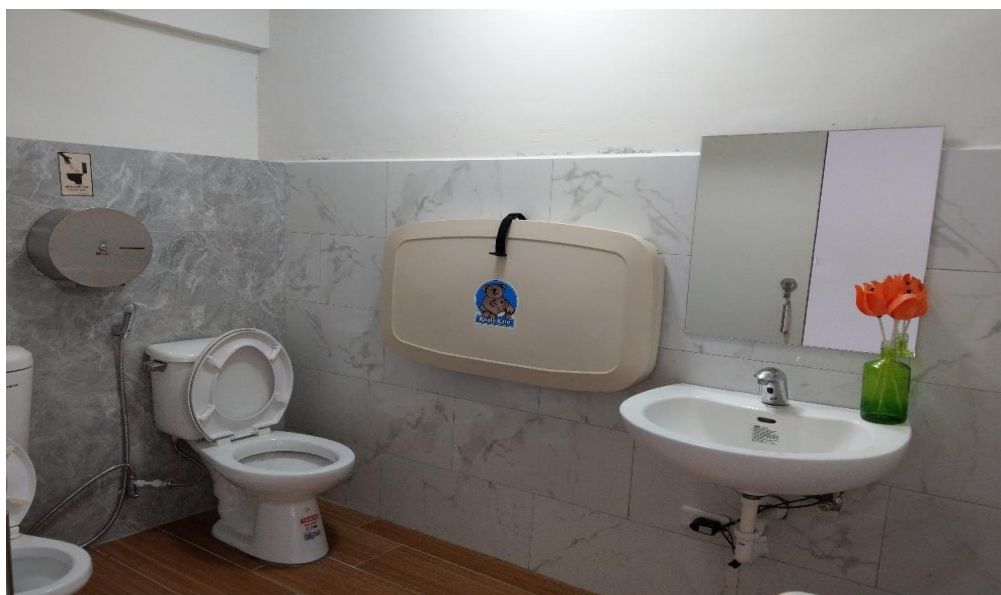
親子公廁內部照(尿布台)