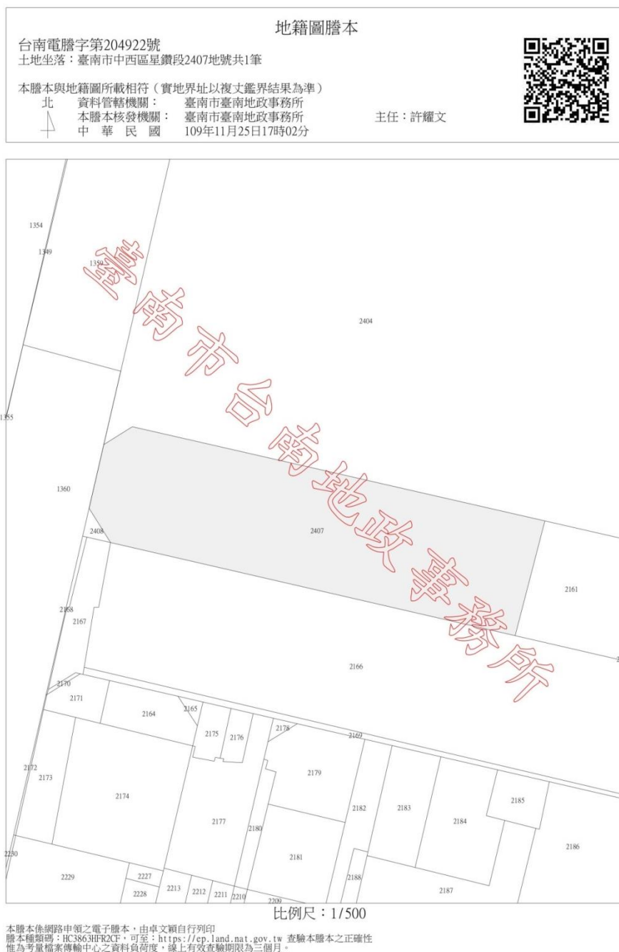
圖 1 基地地籍圖

基地座落於臺南市中西區星鑽段 2407 地號商業區用地:商四(1)，土地面積 1143.49 平方公尺。建蔽率:80%，容積率:320%。土地所有權人為臺南市，管理機關為臺南市政府觀光旅遊局。